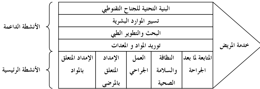
الشكل رقم 02 : سلسلة القيمة للجنح التقنوطي المستوحاة من سلسلة القيمة ل Porter

المصدر: Beatrices Bessombes, Lorraine Trilling, Alain Guinet, Conduit du changement dans le cadre du regroupement de Plateaux Medico- Techniques -apport de la modélisation d'entreprise, op-cit , p 694.